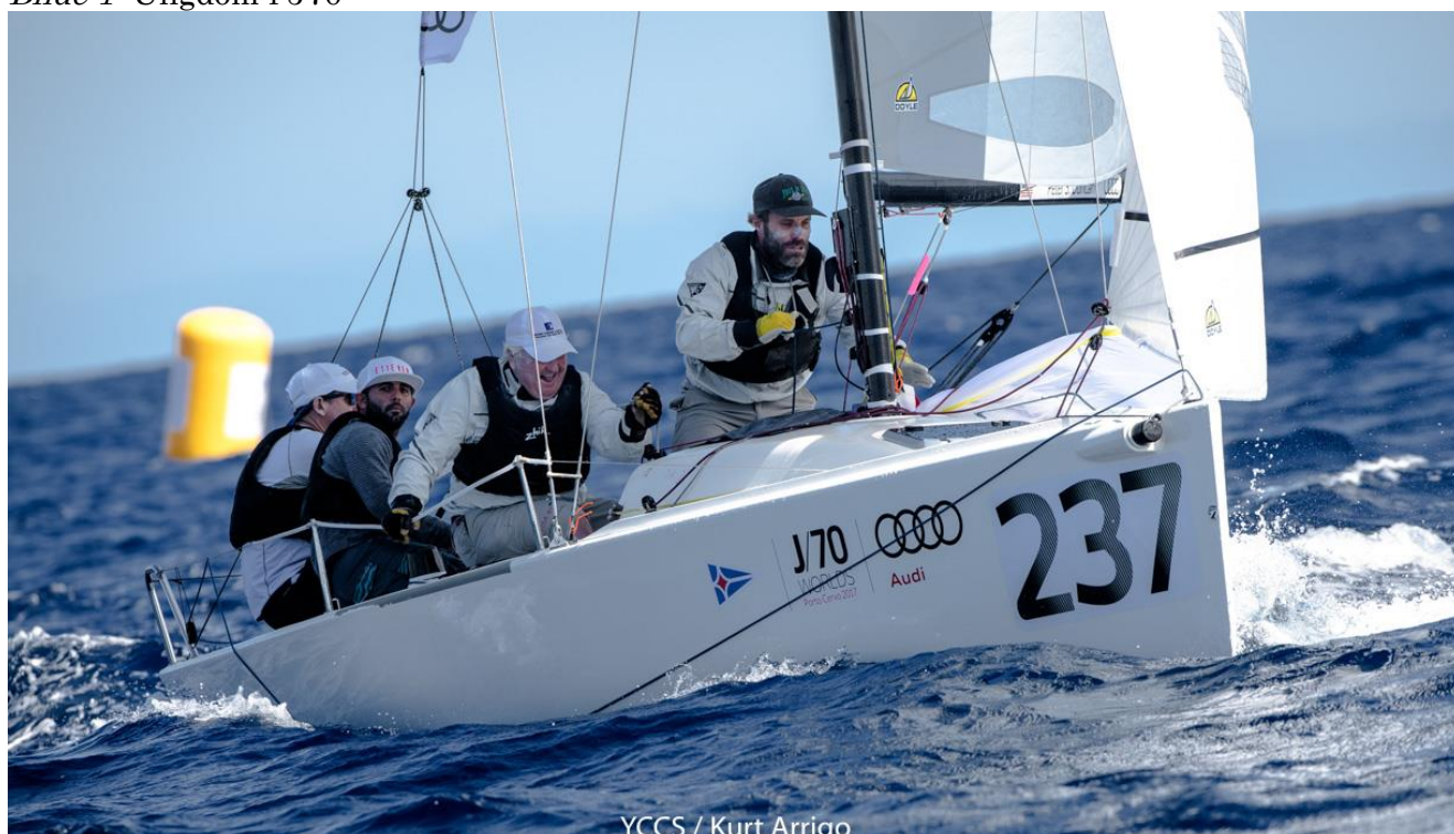
Bilde 2: Godt voksne verdensmestere i J70. Hvorfor J70?