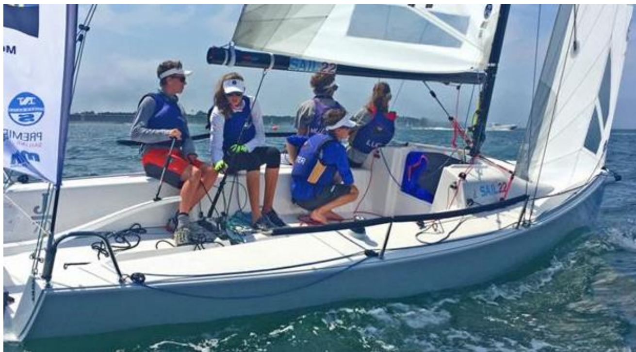
Bilde 1: Ungdom i J70

Båten har en rommelig cockpit, god høyde under bom og er lett å betjene både av unge, voksne og eldre. I god vind planer den fint og gir gode fartsopplevelser.